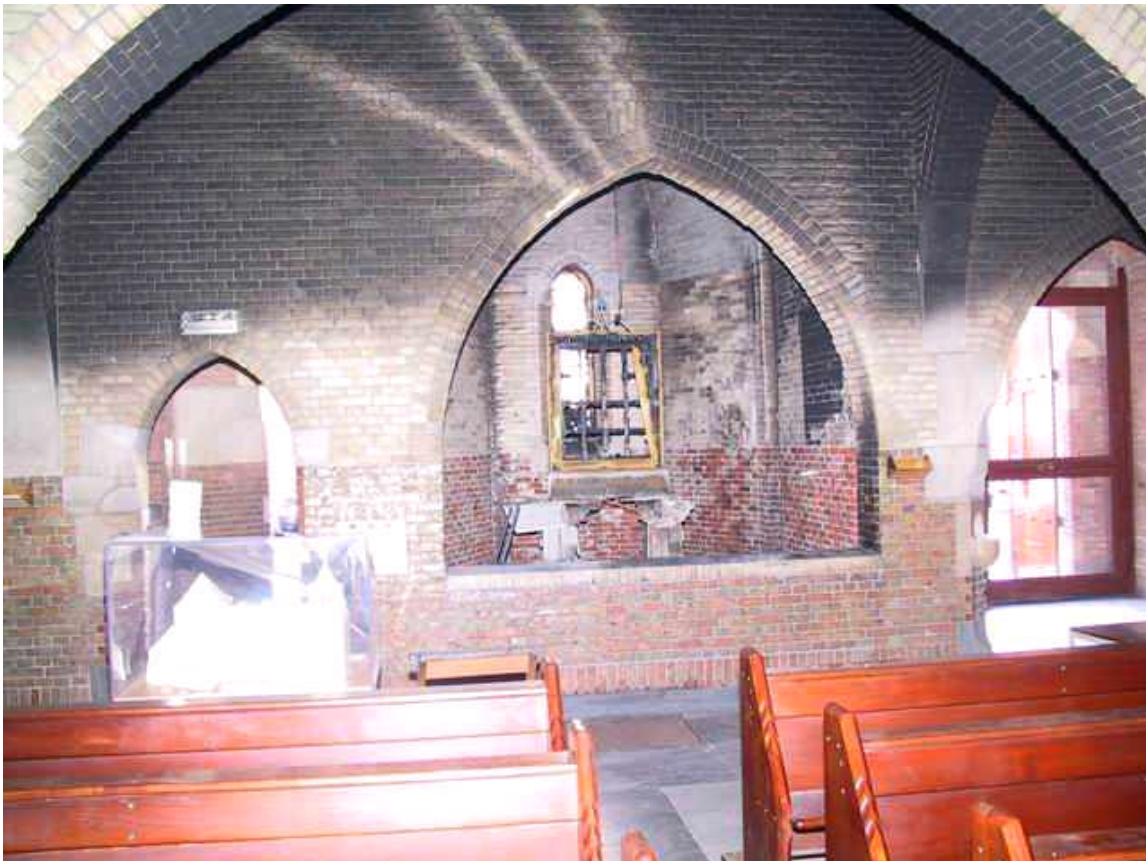
Het trieste beeld van de verbrande Mariakapel