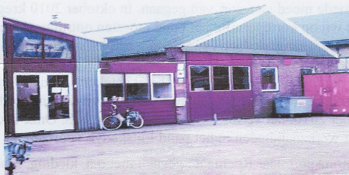
Onze locatie aan de Lutskeyd in Stiens