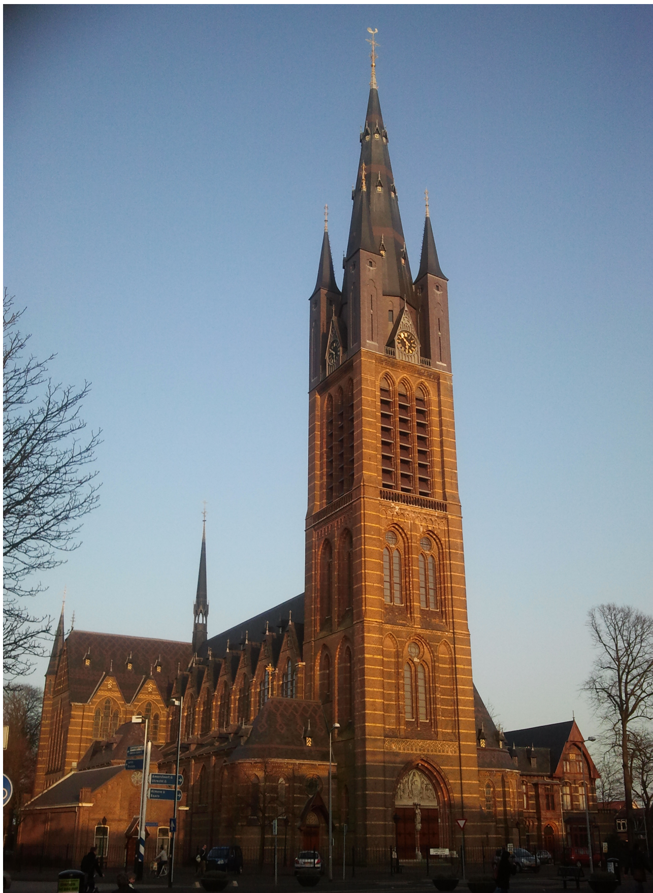
Mooie Kerk in Hilversum !