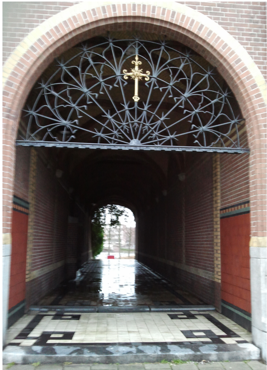
Poort in het centrum van Amsterdam

Elk afscheid is een geboorte van een herinnering. Een man weet nooit hoe hij afscheid moet nemen, een vrouw nooit wanneer. De grote weg is vlak, maar mensen zoeken liever berg paden. De wijze weet zonder te reizen, heeft inzicht zonder te kijken en bereikt iets zonder te handelen. Het afscheid verlengt niet de aanwezigheid maar het vertrek. Beter een mijl te reizen dan duizend boeken te lezen. Het geeft niet waar je heen gaat als je de deur maar openhoudt. Wachten duurt zolang als jij wilt.