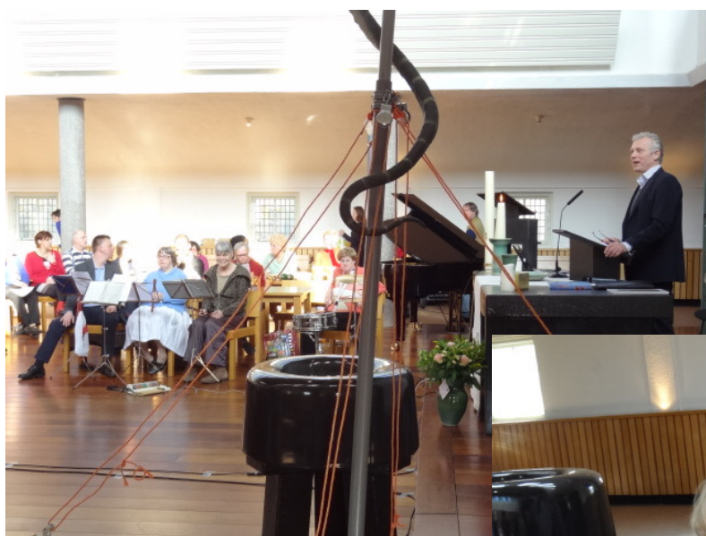
Speciale Dienst verstandelijk beperkten (Beloken Pasen)