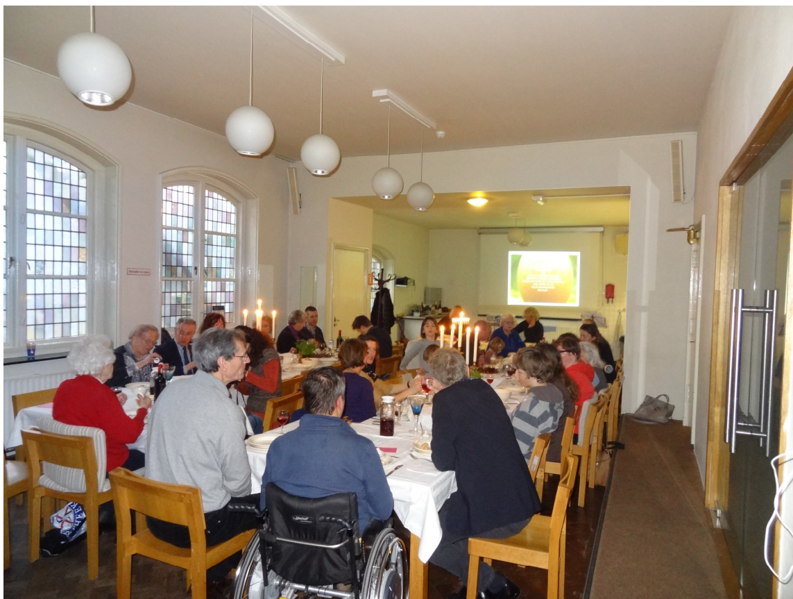
Seidermaaltijd, Witte Donderdag