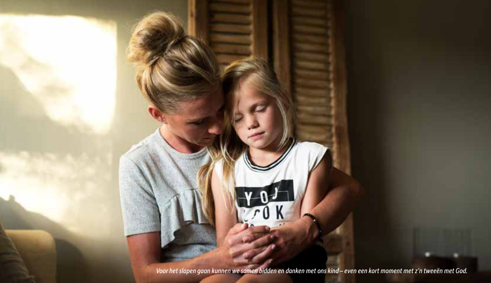
Voor het slapen gaan kunnen we samen bidden en danken met ons kind – even een kort moment met z'n tweeën met God.

meenschappelijks. Daarom maken we onderscheid tussen het gezamenlijk gebed zoals dat op kringen, in de kerk of in het gezin gebeurt, en het persoonlijk gebed, het stille contact tussen God en mij alleen. Er staan mooie beloften in de Bijbel voor mensen die samen bidden. God zegt dat waar twee of drie mensen samen zijn in Zijn Naam, Hij in hun midden is (Matt.18:20). Laten we dus als man en vrouw, als vriendinnen, als ouders met onze kinderen samen bidden. Samen bidden en danken kunnen we ook met ons kind doen op de rand van het bed. Voor het slapen gaan is er dan even een kort moment met z'n tweeën met God.